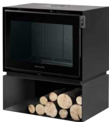
MONTMARTRE 800 C FR9011040B

Vous êtes libre de choisir l'esthétique qui vous plaît le plus parmi une vision XXL avec un grand bûcher , une vision XL avec bûcher , ou le pied central .