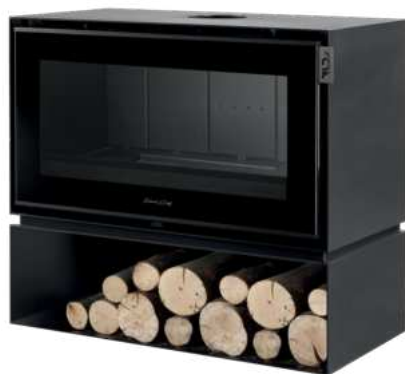
MONTMARTRE 1000 C FR9011070B

Dimensions (L x H x P) : 76 x 93,3 x 50,8 cm