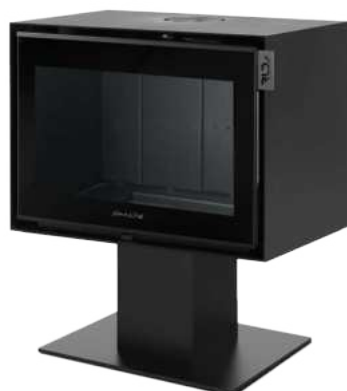
MONTMARTRE 800 P FR9011050B

Dimensions (L x H x P) : 76 x 92 x 51 cm