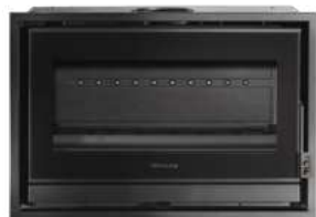
HONORÉ 800 HORIZON FR9011120B

Dimensions (L x H x P) : 80 x 70 x 48 cm