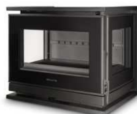
NOUVEAUTÉ HONORÉ 800 VL2 FR9016350B

Dimensions (L x H x P) : 80 x 70 x 48 cm