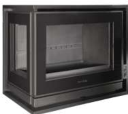
NOUVEAUTÉ HONORÉ 800 VLI G FR9016340B

Dimensions (L x H x P) : 80 x 70 x 48 cm