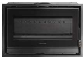
HONORÉ 800 HORIZON FR9011120B

Dimensions (L x H x P) : 80 x 70 x 48 cm