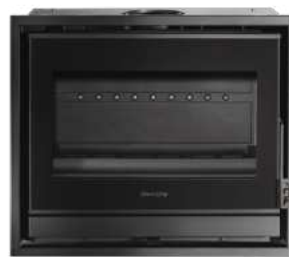
HONORÉ 800 FR9011110B

Dimensions (L x H x P) : 71 x 59,5 x 48 cm