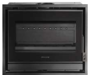
HONORÉ 700 FR9011100B

Dimensions (L x H x P) : 59 x 55,5 x 40,5 cm