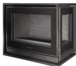
NOUVEAUTÉ HONORÉ 800 VLI D FR9016330B

Dimensions (L x H x P) : 80 x 70 x 48 cm