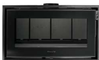
HONORÉ 1000 FR9011150B

Dimensions (L x H x P) : 80 x 59,5 x 48 cm