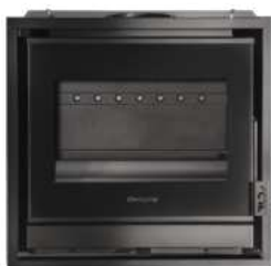
HONORÉ 600 FR9011090B

Découvrons l'histoire des INSERTS HONORÉ , où ingéniosité et élégance se conjuguent pour une expérience de confort et de style unique. Ces bijoux de conception ingénieuse s'adaptent parfaitement à toute cheminée , qu'elle soit existante ou nouvelle , unissant tradition et modernité avec harmonie.